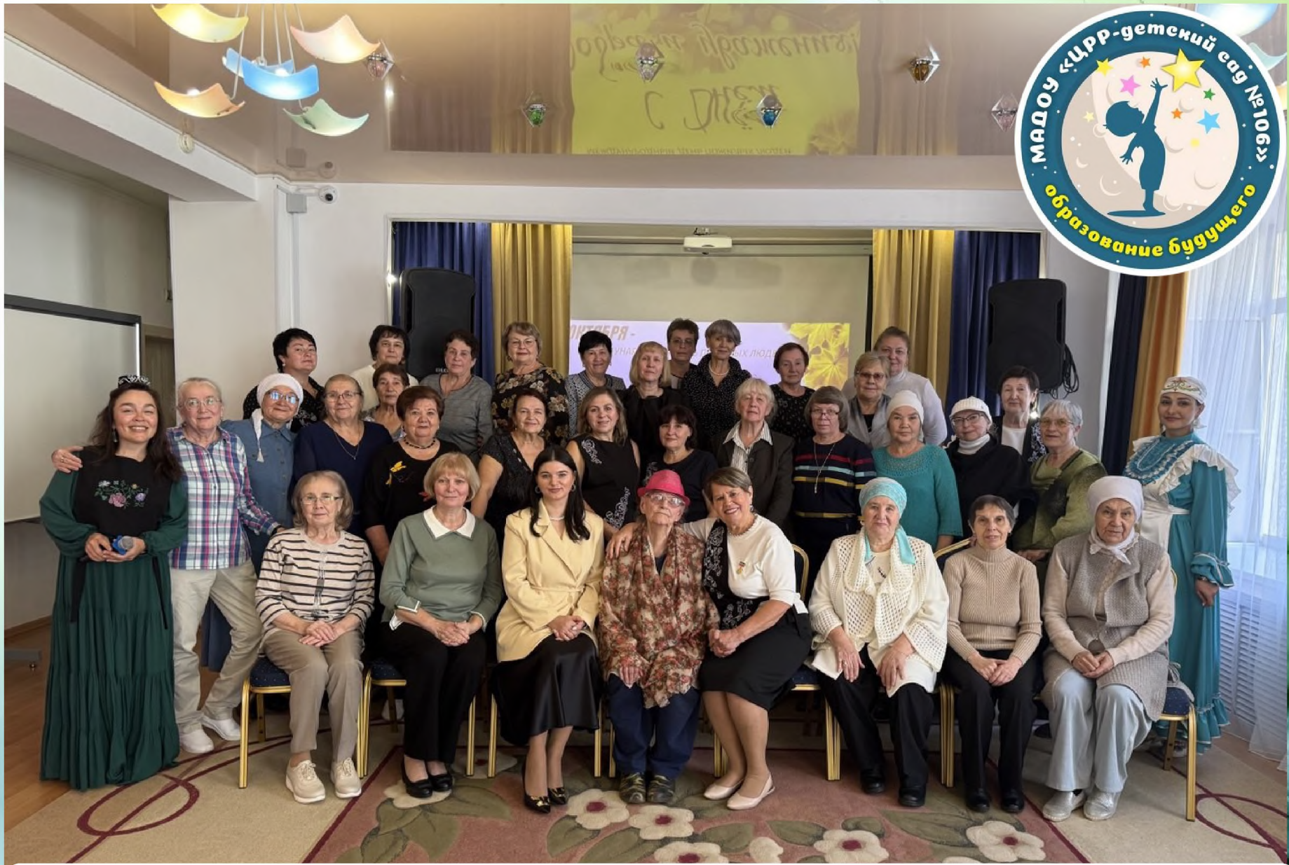
День добра и уважения