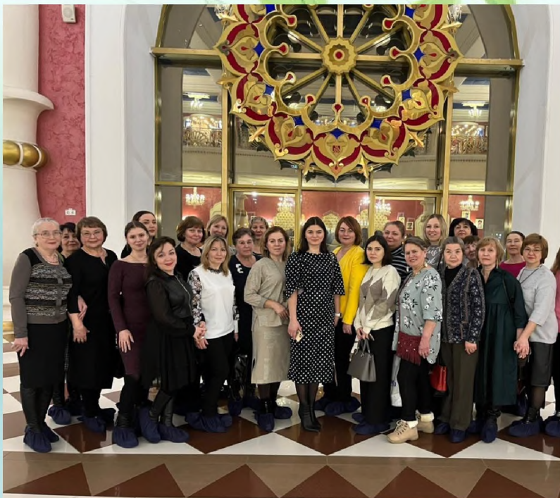
Походы в театр